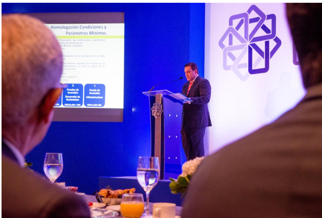
Superintendente de Pensiones, Ramón E. Contreras Genao en su disertación en la actividad.

De igual modo, presentó las principales variables del Sistema de Pensiones al cierre de julio 2018. Expresó que el patrimonio de los Fondos de Pensiones asciende a RD$566,800 Millones de pesos y resaltó el crecimiento exponencial de dicho patrimonio, pasando de representar el 1.1% del Producto Interno Bruto (PIB) en diciembre del año 2003, a ser el 15.7% al corte del 31 de julio de 2018.